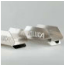
Schlauchhalter aus Aluminium Schlauchhalter SH25 Breite 250 mm Art.-Nr. 105614 Schlauchhalter SH32 Breite 320 mm Art.-Nr. 105616