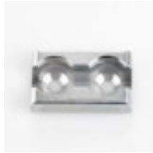
Zurrpunkt Aluminium, eloxiert Art.-Nr. 106153