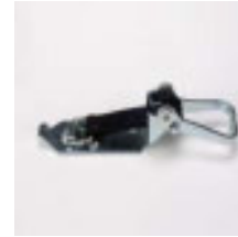
Spannverschluss aus verzinktem Stahl Länge Gummiband 90 mm Art.-Nr. 100893