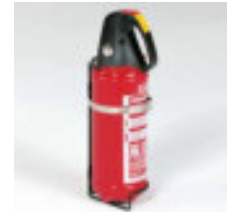
Feuerlöscher 2 kg inkl. Halterung ABC-Löschpulver Art.-Nr. 100912

Weiteres Zubehör finden Sie in unserem Hauptkatalog oder unter www.aluca.de