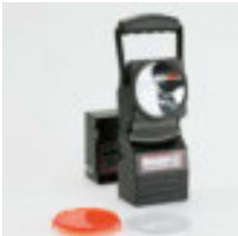
Akku-Handscheinwerfer Arbeits- u. Notstrom- leuchte, explosions- geschützt, inkl. Lade- station u. Halterung Art.-Nr. 102950