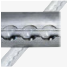
Zurrschiene Aluminium, 990 mm, Art.-Nr. 100963 Aluminium, 1490 mm, Art.-Nr. 100964