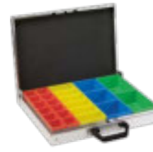
Aluminiumkoffer mit Insetboxen Abb. 1 Art.-Nr. 100921 Abb. 2 Art.-Nr. 100922 Abb. 3 Art.-Nr. 100923