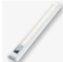
LED-Leuchte 24 Power-LEDs, 8 Watt mit Ein-/Ausschalter Art.-Nr. 104904