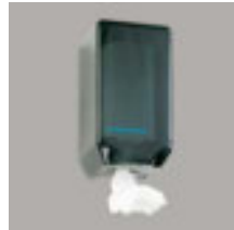
Handtuchhalter mit Papier-Einwegtüchern Art.-Nr. 100938 9 Ersatzrollen Art.-Nr. 100939