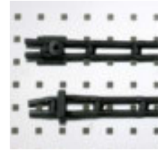
Leitergummi 30 mm breit, mit 2 Einhängeknöpfen, 1 m Art.-Nr. 100985