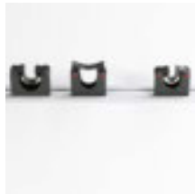
Gerätehalter Gerätehalter 20 - 30 mm Art.-Nr. 101048 Gerätehalter 30 - 40 mm Art.-Nr. 101049 Schiene 500 mm Art.-Nr. 101050 Schiene 900 mm Art.-Nr. 101051