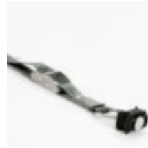
Spanngurt mit Klemmschloss, 1 m Art.-Nr. 100982 mit Klemmschloss, 2 m Art.-Nr. 100983