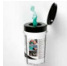
Feuchte Reinigungstücher Inhalt 50 Tücher Art.-Nr. 100943 Wandhalterung Art.-Nr. 100945