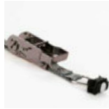
Zurrgurt mit Ratsche, 1 m Art.-Nr. 100979 mit Ratsche, 2 m Art.-Nr. 100980