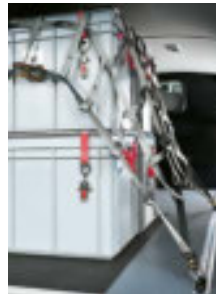
Ladungssicherungsnetz 1200 x 1800 mm mit umlaufendem Ratschenschloss- Ringgurt Art.-Nr. 101014