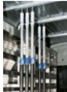
Teleskop-Sperrstange Aluminium Länge 1250-1750 mm Art.-Nr. 103512 Länge 1550-2050 mm Art.-Nr. 103153